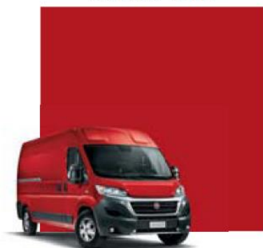
199 Rosso Tiziano