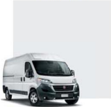
549 Bianco Ducato