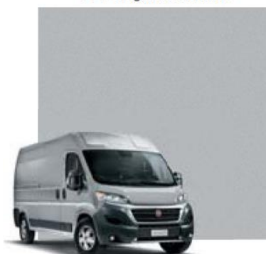
611 Grigio Alluminio