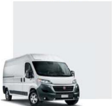
549 Bianco Ducato