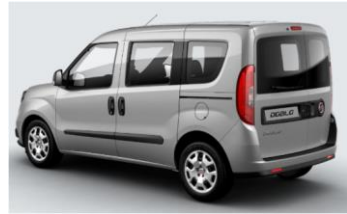
Забарвлення кузова фарбою металік (код 695)