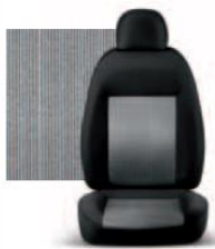
PIN STRIPE GRIGIO 223