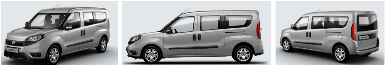
Забарвлення кузова фарбою металік (код 695)