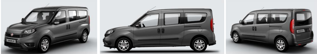
Забарвлення кузова фарбою металік (код 722)