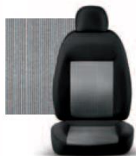
PIN STRIPE GRIGIO 223