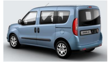
Забарвлення кузова фарбою металік (код 612)