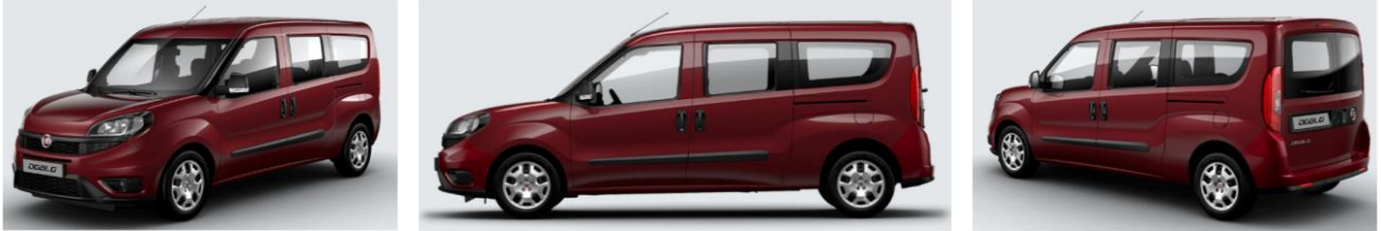
Забарвлення кузова фарбою металік (код 448)