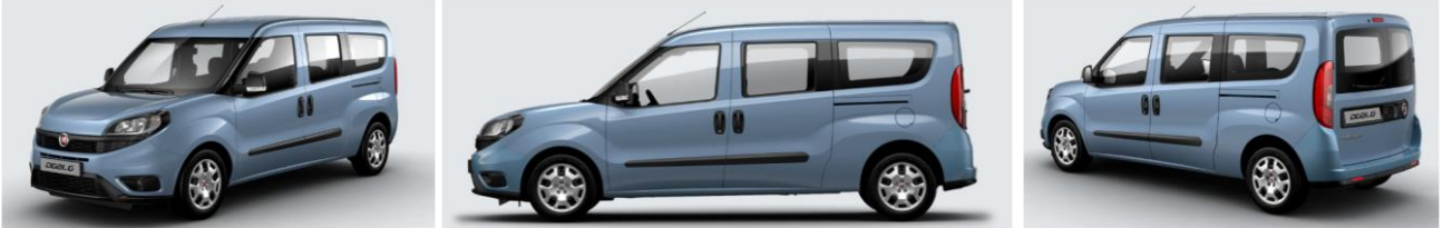
Забарвлення кузова фарбою металік (код 612)