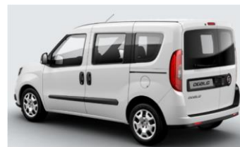
Забарвлення кузова фарбою металік (код 293)