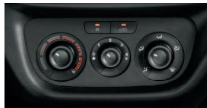
Кондиціонер з ручним регулюванням