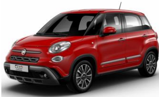
код фарби 111