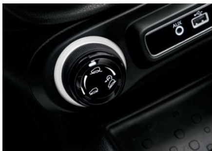
Drive Mood Selector (селектор вибору режиму водіння)