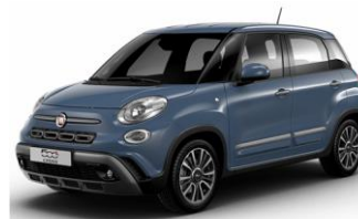
код фарби 652