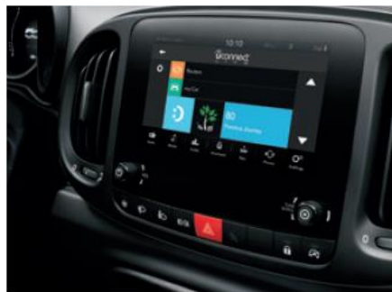
7" кольоровий сенсорний екран, радіо,