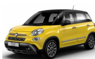
код фарби 970