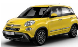
код фарби 830