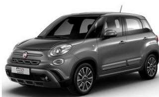
код фарби 609