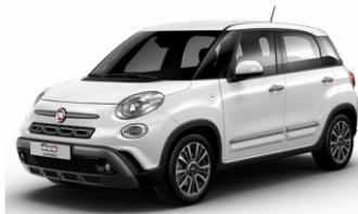
код фарби 268