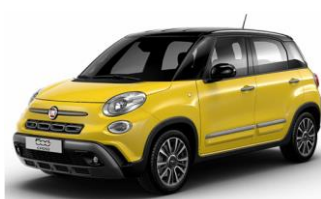
код фарби 828