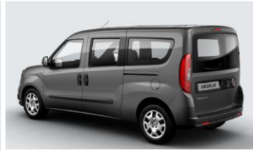
Забарвлення кузова фарбою металік (код 722)