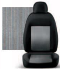
PIN STRIPE GRIGIO 223