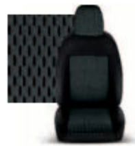
STAR GRIGIO 213