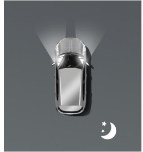
Автоматичне дальнє світло