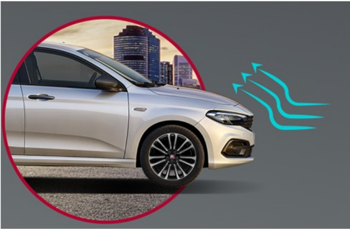
Активна заслонка решітки радіатора